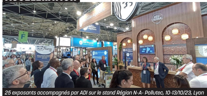
25 exposants accompagnés par ADI sur le stand Région N-A- Pollutec, 10-13/10/23, Lyon