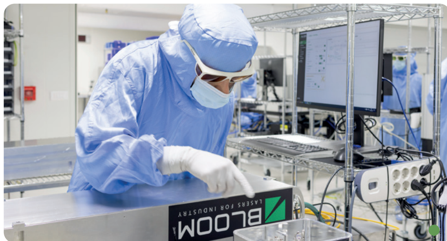
Bloom Lasers

Enterprise Europe Network* , financé par la Commission européenne, est un réseau de + de 4 000 membres issus de 65 pays. ADI y mobilise les diverses parties prenantes qui enrichiront les projets qu'elle accompagne, fournisseurs, partenaires voire clients potentiels. En 2023, 293 porteurs de projets ont bénéficié de ses ressources.