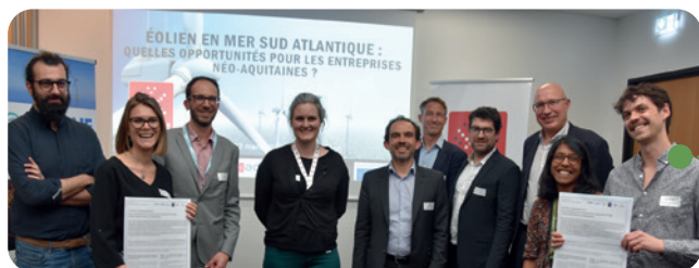
« Projet de parcs éoliens en mer au large de l'île d'Oléron : quelles opportunités pour les entreprises néo-aquitaines ? » • Rencontre du 22 mars 2023 • La Rochelle (17)