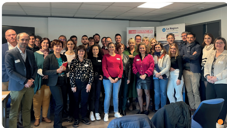
Rencontre ADI/AURA • Photo © ADI

Responsable service Implantation d'entreprises