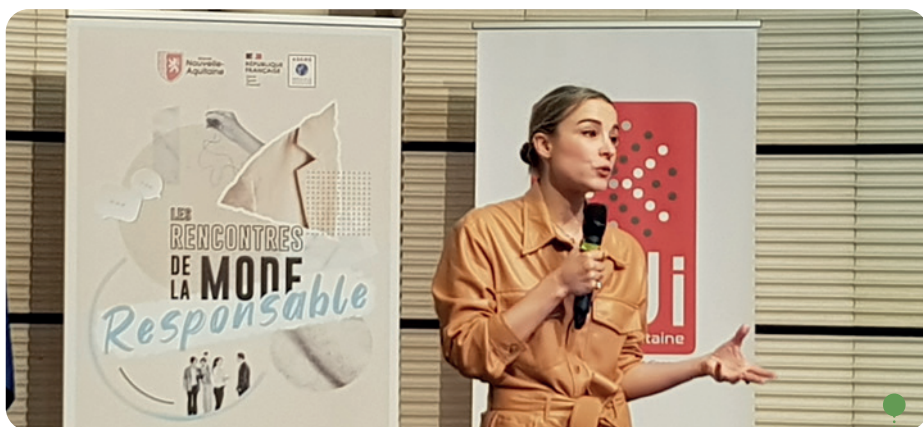
1 res Rencontres de la mode responsable - Poitiers • Photo © ADI

Le 19 octobre, sollicitée par la Région, ADI organisait ce meeting professionnel inscrit au programme de la 1 re Semaine de la mode responsable (Poitiers). Soit l'identification des 110 intervenants, panel bien représentatif de la chaîne de valeur, dont des artisans, associations et entreprises innovantes témoignant de la force de frappe néo-aquitaine en matière de gestion et d'upcycling des déchets textiles. Cet événement a été créé pour compléter l'incontournable Biarritz Good Fashion . Toujours en 2023, et en collaboration avec Soltena , ADI a organisé 2 webinaires pratico-pratiques, l'un sur l'écoconception, b.a.-ba d'un modèle vertueux, l'autre sur la teinture naturelle et écologique.