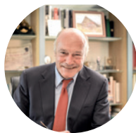
Alain Rousset Président de la Région Nouvelle-Aquitaine Président du Conseil de surveillance d'ADI

Notre fil d'Ariane est de soutenir l'innovation responsable, d'aider à franchir les sauts technologiques, qui nous rendent plus compétitifs face à la concurrence internationale. Nos résultats parlent d'eux-mêmes. La Région a concentré 36 % de l'emploi industriel net de France en 2019. Et, en 2023, la Nouvelle-Aquitaine était la deuxième région française, en termes de créations nettes de sites industriels. Le fruit d'une politique de long terme, pour remettre l'humain au cœur de l'entreprise, lancée dès 2014 avec le programme « Usine du futur ».