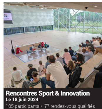
Rencontres Sport & Innovation

« L'économie circulaire, le développement durable et la RSE occupent la place n°1 de nos orientations stratégiques. Nous consacrons beaucoup d'ateliers et groupes de travail à l'impact environnemental, sur des thématiques préconisées par nos adhérents : veille et mise à jour de la réglementation, business model responsable, biosourcing, cycle de vie du produit, espace de vente circulaire... Les activités de collecte, réparation ou d'upcycling sont des leviers cruciaux et on obtient des résultats. Oxbow, par exemple, que nous accompagnons, a relocalisé une partie de sa production pour créer Collector, marque 100% made in France, de même que les magasins-ateliers Stay Alive, qui réinjectent des produits surf d'occasion, constituent aussi des outils de communication et de sensibilisation puissants. »