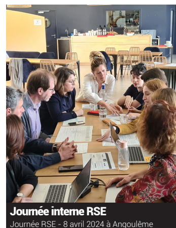
Journée interne RSE

« En 2022, nous avons engagé l'état des lieux, point de départ de la démarche RSE. En 2023, nous avons identifié les risques, opportunités et impacts des activités de l'Agence, puis confronté cette analyse à nos parties prenantes. C'est une expérience très instructive que de sonder son propre écosystème professionnel , de relever les attentes d'un chef d'entreprise qu'on connaît bien ou, a contrario, d'un partenaire financier avec lequel on n'a habituellement pas d'interaction. Aujourd'hui, on est en mode déploiement des projets, on apprend en marchant ensemble. Le comité RSE, renouvelé en 2024 et organe de suivi de notre politique RSE, est un lieu d'échange, à l'écoute des besoins, témoin des nombreuses initiatives et engagements des collègues d'ADI. »